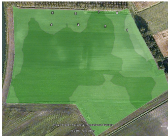
Figuur 1: Biomassakaart

De basis voor de zoektocht naar achterblijvende gewasontwikkeling is de biomassakaart (fig. 1). Het is een 'routeplanner' om naar mogelijke oorzaken te zoeken. Grondmonsters (Spurway analyses) geven inzicht in de nutriëntenhuishouding binnen de verschillende biomassazones. Om echte oorzaken waar te nemen moeten de biomassawaarden, in de verschillende zones, wel verschillen tonen.